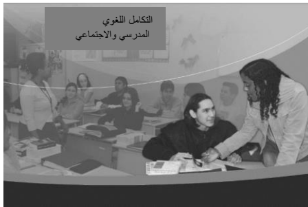
التكامل اللغوي المدرسي والاجتماعي

★ جميع موظفي المدرسة مسؤولون عن الاندماج اللغوي والمدرسي والاجتماعي لطفلك.